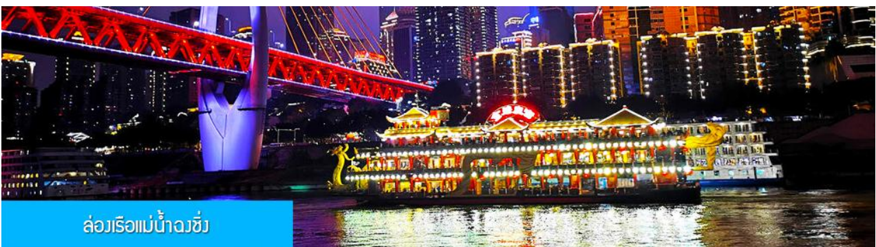
ล่องเรือแม่น้ำจิวชี่