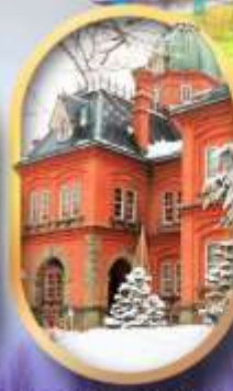
ศาลาว่าการฮอกไกโด