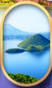
อ่าวทะเลสาบโทโยะ