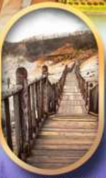
หุบเขาจิกุกดาบิ