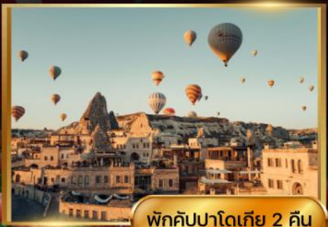
พักคิปปาโดเกีย 2 คืน