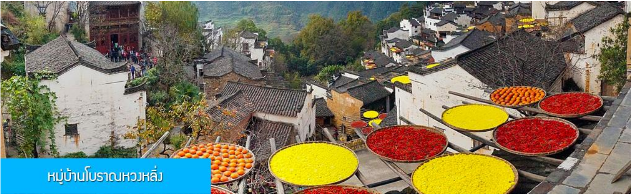
หมู่บ้านโบราณหวงหลิ่ง