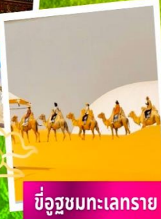
ขี่อูฐชมทะเลทราย