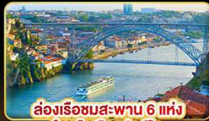
ล่องเรือชมสะพาน 6 แห่ง ในคูโรเมืองปอร์โต