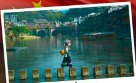
หมู่บ้านเฟิ่งทง

สุดคุ้ม!! พัก 5 ดาว ทุกคืน มนตร์เสน่ห์เมืองเก่า ริมสาងน้ำแห่งจินเจี้ยน