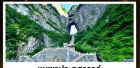
หุบเขาประตูสวรรค์