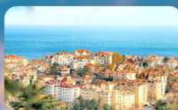
จุดชมวิว Signal Hill Park