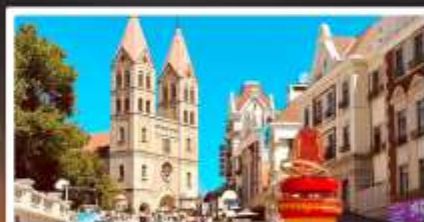
โบสถ์เซนต์ไมเคิล