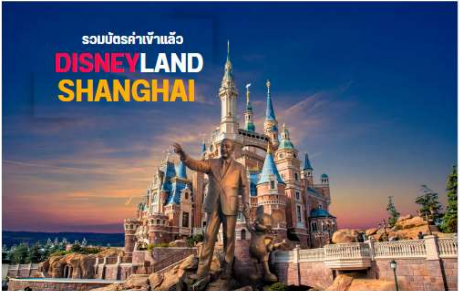
DISNEYLAND SHANGHAI ดิสนีย์แลนด์เซี่ยงไฮ้

ไม่เข้าสวนสนุก DISNEY LAND หักออก 2,000 บาท