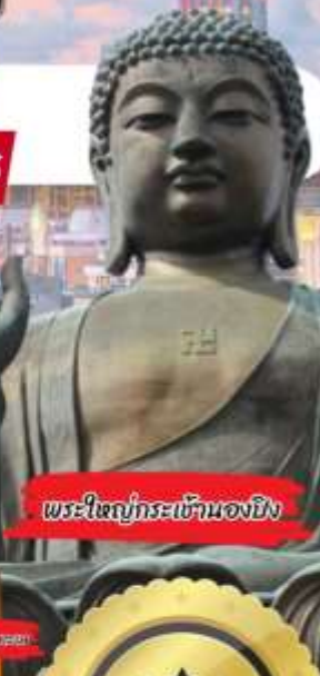
พระใหญ่กระเช้านองยี่ง