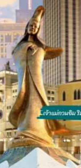
เจ้าแม่กวนอิม ริมทะเล