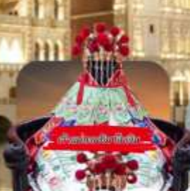
วัดของเจ้าแม่กวนอิม