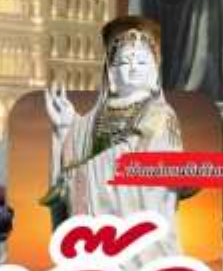
พิพิธภัณฑ์วิทยาศาสตร์