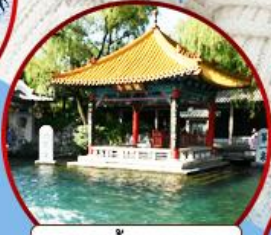
บ่อน้ำพุเป่าหู