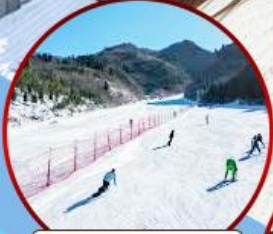
ลานสกีจินซาน