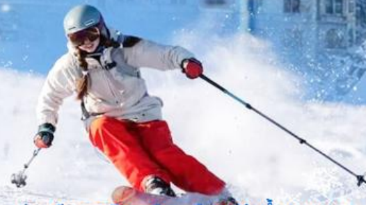
เล่นสกีทะเลยหิมะ เมืองเมืองแห่งน้ำพุ ซานตง