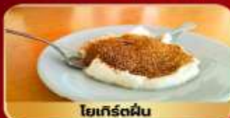
โยเกิร์ตผืน