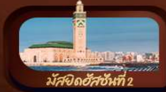
มัสยิดฮัสซันที่ 2