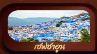
เชฟชาอูน