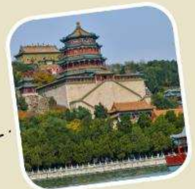
4 พระราชวังฤดูร้อน