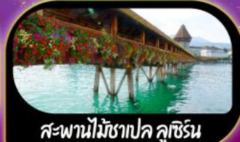
สะพานไม้ฆาปค ลูซิริน