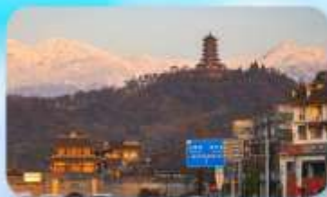
เมืองโบราณกวนเสี้ยน