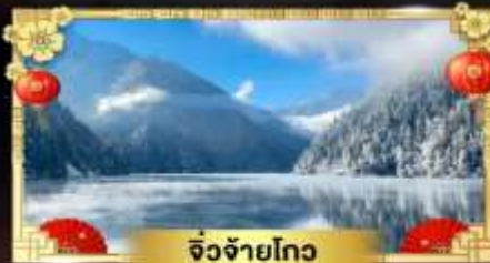
จี๋จ้ายโกว