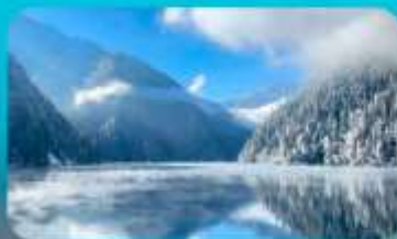
จี๋จ้ายโกว